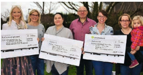
Die Spende stammt von einem ehrenamtlich organisierten Weihnachtsmarkt.