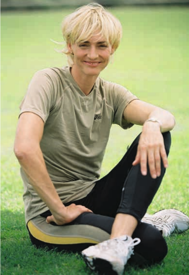
Heike Drechsler ist eine der bekanntesten deutschen Leichtathletinnen. Nach ihrer aktiven Karriere gibt sie unter anderem als Buchautorin Tipps für ein aktiveres Leben.