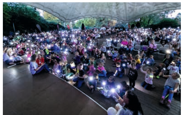
Das Taschenlampenkonzert bietet ein unvergessliches Musikerlebnis im Grugapark.

Der Musikpavillon im Grugapark als Lichtermeer: Dieses Bild entsteht beim Taschenlampenkonzert, das in den vergangenen Jahren bei den Besuchern für unvergessliche Momente sorgte. Auf der Bühne animiert die Band Rumpelstil mit ihrem Lied-Repertoire von Swing bis Rock zum Mitsingen, Tanzen und Lachen. In diesem Jahr sind mit dem 27. und 28. September erneut gleich zwei Konzerttermine vorgesehen, um vielen Menschen das besondere Konzerterlebnis zu ermöglichen. Der Erlös der Veranstaltungen unterstützt die Elternberatung „Frühstart“/Bunter Kreis am Universitätsklinikum Essen. Die Initiative hilft Eltern von zu früh geborenen