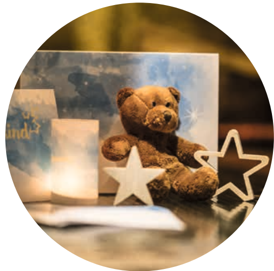
Die Sternenkind-Box soll bei der Trauerarbeit helfen.