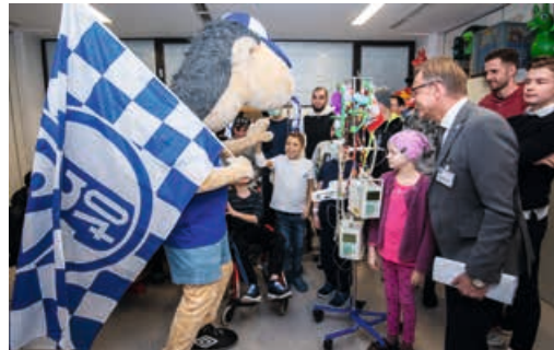
Der königsblaue Besuch – inklusive Maskottchen - sorgte für Abwechslung bei den kleinen Patienten.