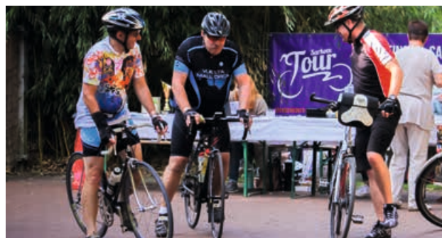
Mit Sport Gutes tun – das können die Teilnehmer bei der Sarkomtour am Baldeneysee.

Sarkomtour ist somit eine große Hilfe, um wichtige Grundlagenforschung zu betreiben und neue Therapieformen zu ermöglichen.