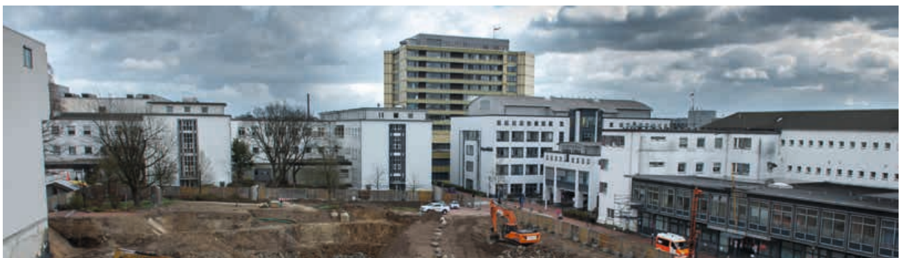
Der Bau hat begonnen: Hier entsteht die neue Kinderklinik.

eingeflossen. Das Ziel: Eine Klinik, die medizinische Spitzenversorgung bietet, und in der die Kinder auch einfach Kind sein können. Da die Zuwendung der Eltern bei der Behandlung entscheidend ist, soll es bessere Übernachtungsmöglichkeiten für die Angehörigen geben. Auf der Kinderintensivstation sind beispielsweise mehr Einzelzimmer mit Zusatzbett geplant. Außerdem genügend Aufenthaltsräume für Eltern und ein Raum der Stille, in dem Patienten und Angehörige einen Platz für Ruhe und Reflexion finden. Zahlreiche Spiel- und Freiflächen sollen dabei helfen, dass die Kinder für einen Moment den Klinikalltag vergessen können. Die Stiftung Universitätsmedizin fördert die kindgerechte Einrichtung der Klinik.