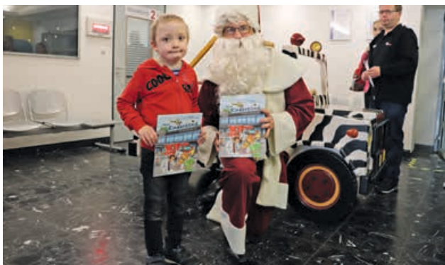
Besinnliche Stimmung im Frühling: Ein überraschender Besuch des Weihnachtsmanns erinnerte an das erfolgreiche Weihnachtssingen.

Ja is' denn heut' scho' Weihnachten? Nein, aber es war! Und zum dritten Mal hatte die Stiftung Universitätsmedizin in der Vorweihnachtszeit zum gemeinsamen