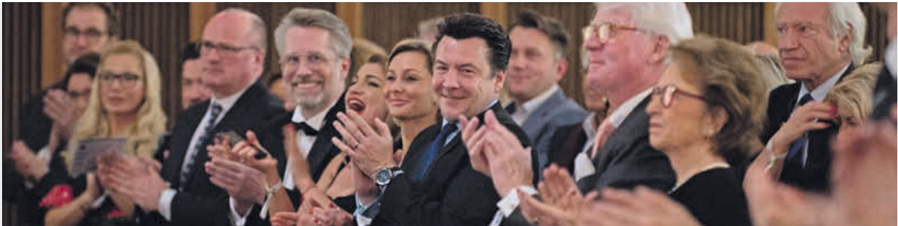
Das Publikum genoss die klassischen Klänge in der Lichtburg.